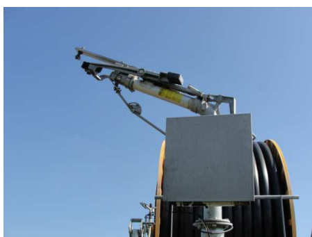
Gun corner fixé sur un canon